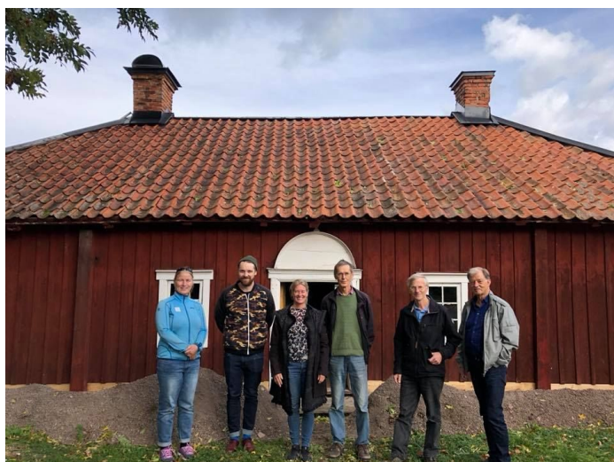
Gamla prästgården i Lagga.

Föreningsrådet ser olika behov att utveckla för föreningarna själva, för kommunen att ta hänsyn till och för politikerna att känna till. För att göra det enklare för tjänstemännen att veta vad de har att göra med på landsbygden så bjöd föreningsrådet in till en rundtur i Lagga och Långhundra eftermiddagen 24 september.