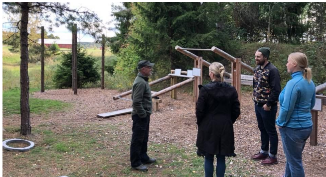
Utegymmet vid främjarstugan i Långhundra.

som nyttjar platsen och det lokala engagemanget. Mellan stoppen gavs mer information om bygden och det som passerades, t ex Väsby kvarn, Blå Wingen, Lagga ridskola, Hönsgärde och Brunnbybadet.